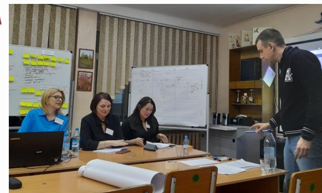
«Муниципальное экспертное сообщество»