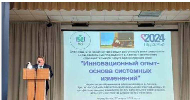
XVIII педагогическая конференция