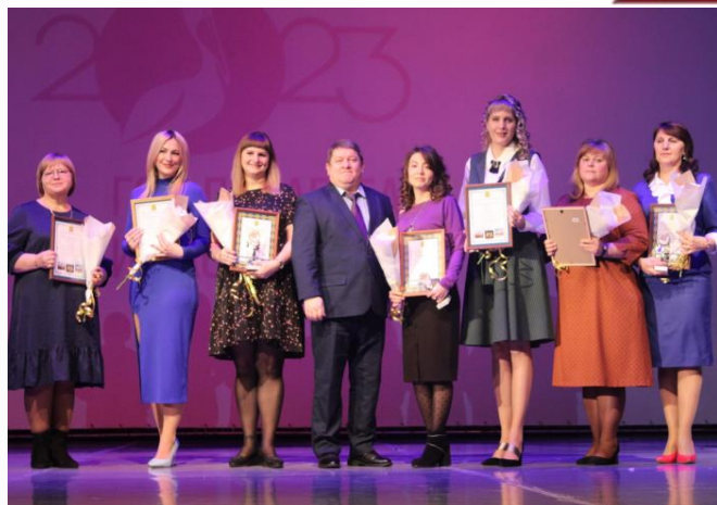
Конкурсы профессионального мастерства