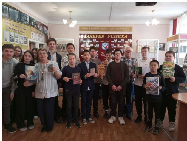
Музей «Горьковец» МБОУ СОШ №2