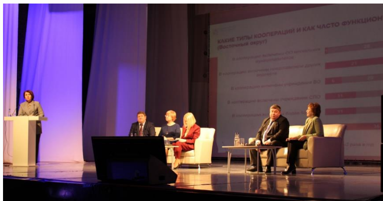
Окружной семинар - совещание