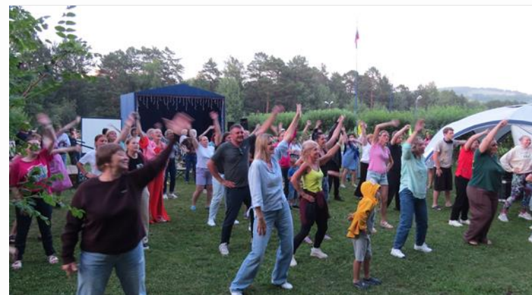
«Тепсей-транзит: территория здоровья»