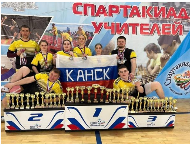
Команда учителей г. Канска

2 место на краевой Спартакиаде педагогов образовательных организаций