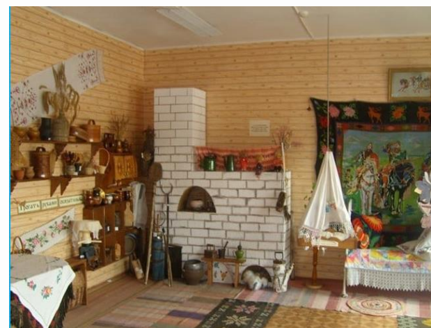
Этнографо-краеведческий музей «Сибирская изба» МБОУ СОШ № 15