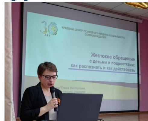
Окружной семинар «Обеспечение профилактики буллинга, насилия в отношении детей, суицидального, агрессивного, экстремистского поведения подростков»