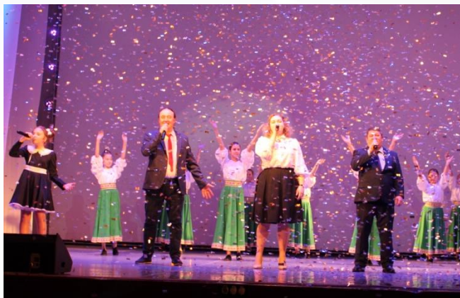
Закрытие Года педагога и наставника