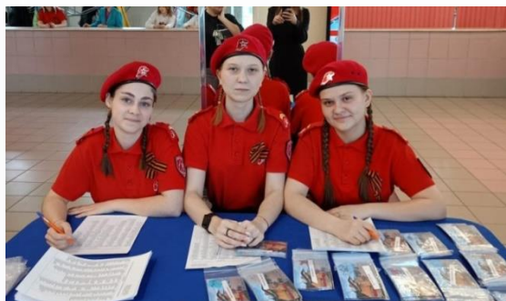
Юнармейцы - волонтеры