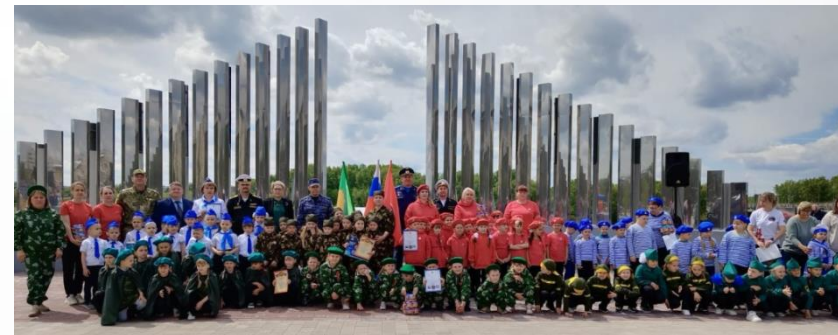
Парад отрядов юнармейцев