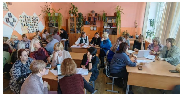
Форум управленческих практик