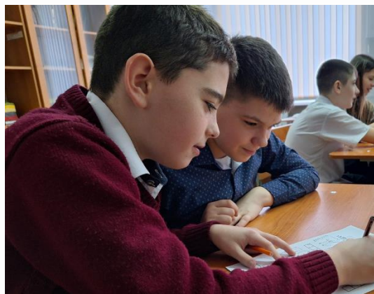
Реализация проекта «Стратегия жизненного успеха»