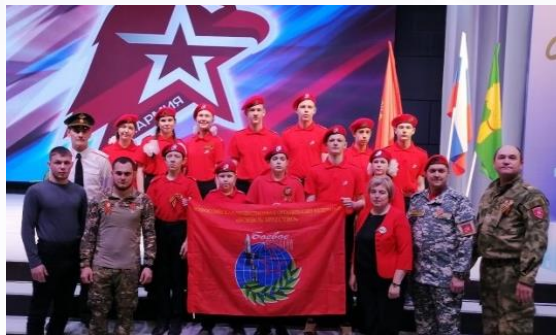
Посвящение старшекласников в ряды юнармейцев