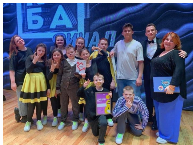
Команда КВН «33 копейки» МАОУ гимназия № 4