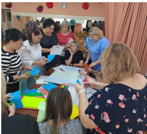
Мастер-классы для родителей