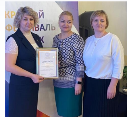
«Лучший инклюзивный детский сад» - МАДОУ № 15