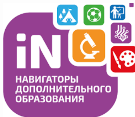
Навигатор для родителей