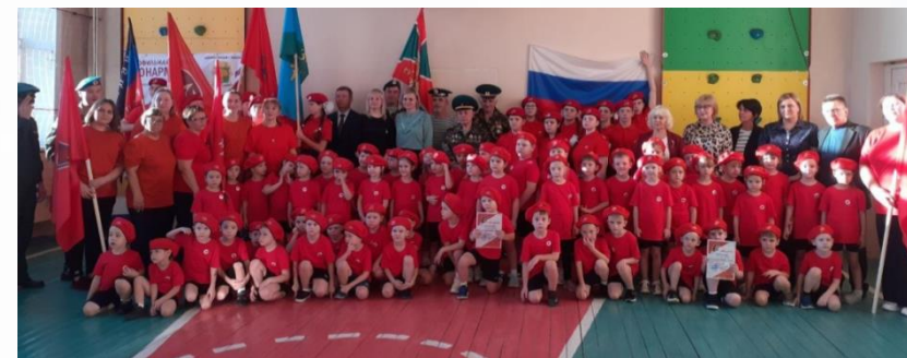
Посвящение воспитанников детских садов в ряды юнармейцев

197 воспитанников ДОУ (№№ 5, 7, 8, 25, 28, 34, 49, 50, 53)