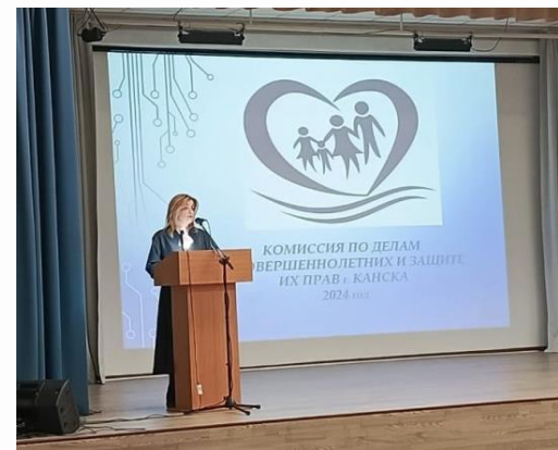
Форум практик профилактической работы «Право на счастливое детство»