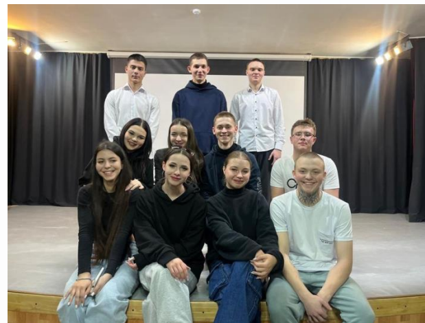
Театральная студия «Мечта» МБОУ СОШ № 6