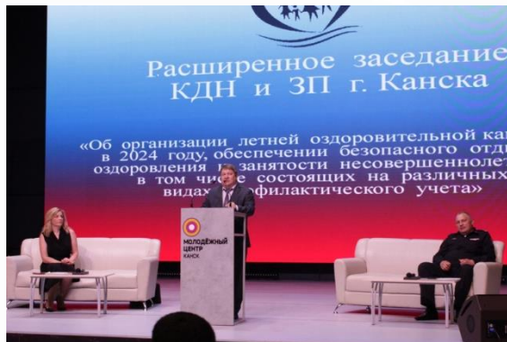
Расширенное заседание КДН: «Об организации летней оздоровительной кампании в 2024 г.»