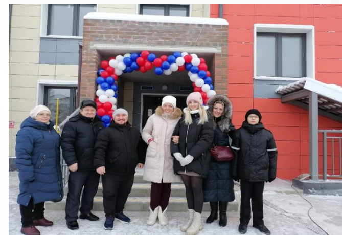
Вручение ключей от квартир в новом доме