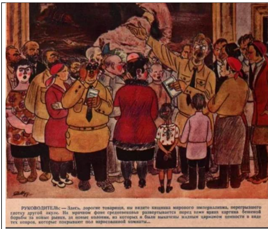
РУКОВОДИТЕЛЬ: — Здесь, дорогие товарищи, вы видите хищника мирового империализма, перегрызшего глотку другой акуле. На мрачном фоне грелеевского развертывается перед вами яркая картина бешеной борьбы за новые рынки, за новые колонии, из которых я был выключен жалким царизмом ценности в виде тех козлов, которые покрывают пол нарисованной комнаты...