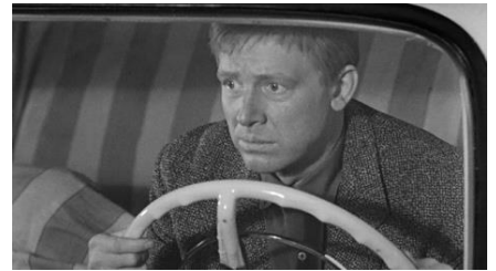
В фильме «Берегись автомобиля» Э. Рязанова