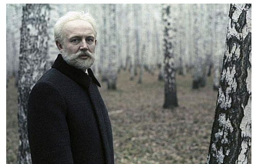
В фильме «Чайковский» И. Таланкина