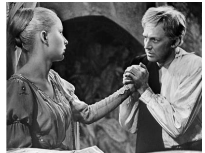
В фильме «Гамлет» Г. Козинцева