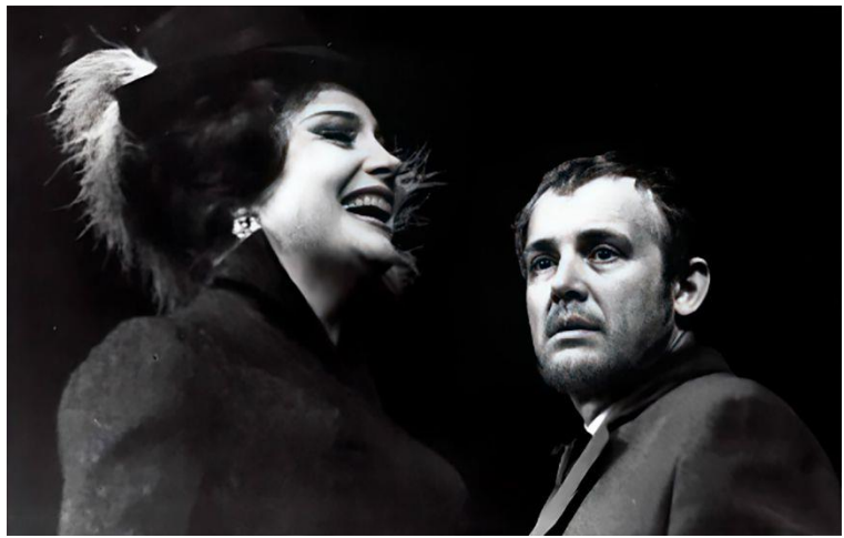
В роли князя Мышкина в спектакле «Идиот»