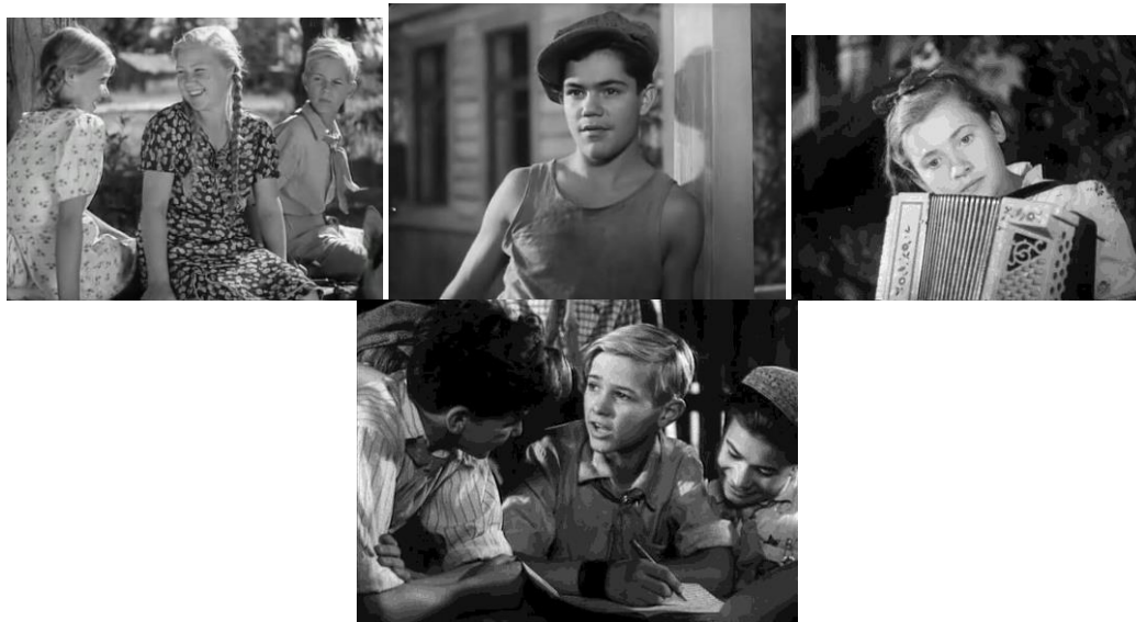
«Тимур и его команда»

6. Изобразите план размещения локаций, на которых будут проходить события юбилейного мероприятия: где они будут располагаться, какое пространство предполагается (открытое – сквер или парк, или закрытое – музей, дом культуры...), какими переходами связаны друг с другом, как это согласуется с расписанием мероприятия.