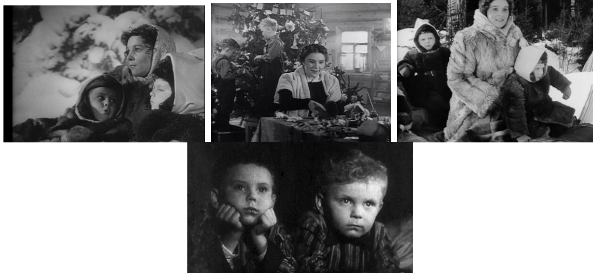
«Чук и Гек»