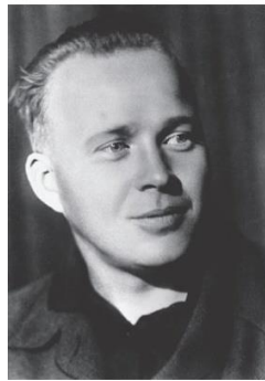
«Судьба барабанщика» и портрет писателя Аркадия Петровича Гайдара