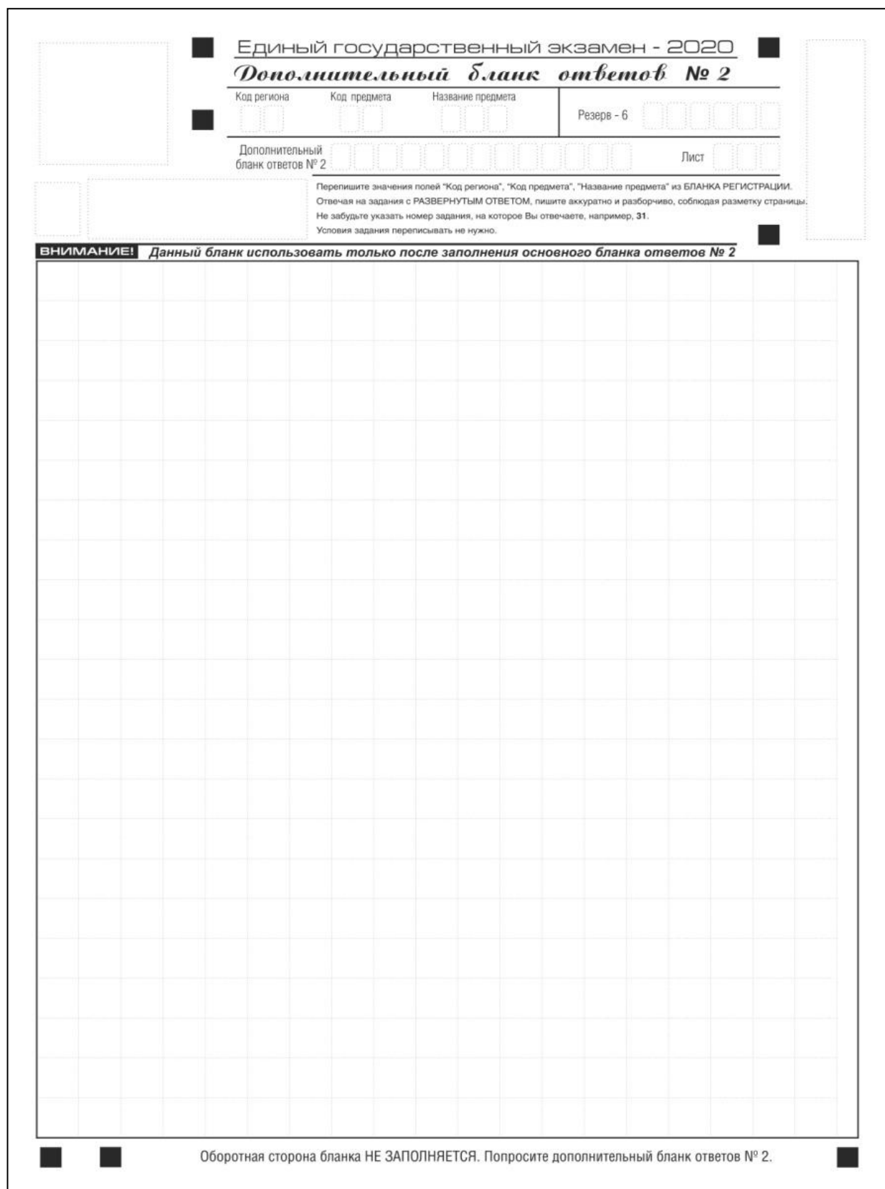
Рис. 16. Дополнительный бланк ответов № 2 по китайскому языку